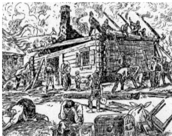
Pożar w drewnianej zabudowie najczęściej kończył się tragicznie.

Wczesne osiedla miejskie budowano z drewna, co gorsza zazwyczaj bez żadnego planu. Nagminnym zjawiskiem było dostawianie drewnianych krużganków, ganków, schodów i schowków, co występowało nawet w późniejszych wiekach. Na przykład w Warszawie ratusz, usytuowany na środku Rynku Staromiejskiego, był jeszcze do początku XIX w. dosłownie obudowany kramami i warsztatami rzemieślników. W Krakowie powszechnie stosowano drewniane dobudówki i takie pokrycia dachowe. Jeszcze w XVI w. było tam dużo drewnianych domów krytych słomą. Niektóre budynki nie miały szyb, a otwory okienne zabezpieczano tylko okiennicami. Plagę pożarów najlepiej ilustruje sytuacja w dwóch najważniejszych miastach Polski: Krakowie i Warszawie. W Krakowie wielkie pożary miały miejsce w latach: 1125, 1205, 1241, 1259, 1285, 1306, 1405, 1407, 1445, 1504, 1528, 1536, 1587, a w Warszawie w latach: 1384, 1480, 1515, 1607, 1697. Groźne pożary zniszczyły też wiele mniejszych miast polskich.