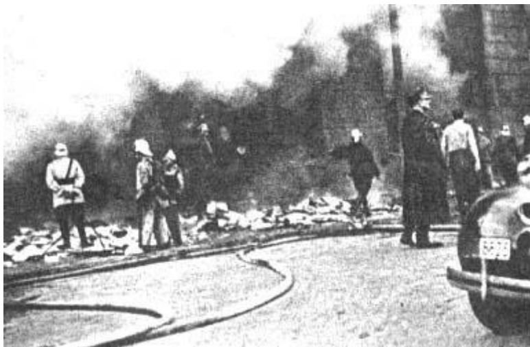
Jedna z akcji gaśniczych w czasie okupacji

Działalność straży pożarnych w czasie hitlerowskiej okupacji prowadzona była w trudnych i bardzo skomplikowanych warunkach. Polecenia i zadania ustalone przez okupanta dla polskich straży pożarnych nie odpowiadały interesom i dążeniom zniewolonego społeczeństwa polskiego. Tym trudniejsza była sytuacja strażaków i działaczy pożarniczych skupionych w jednostkach straży pożarnych. Jednak pod pozorem wykonywania zadań narzuconych przez okupanta realizowali oni wytyczony cel podstawowy – służbę i działalność dla społeczeństwa i czynne włączenie się do walki o wyzwolenie ojczyzny. Zadania powyższe polskie pożarnictwo realizowało również w tajnej organizacji podziemnej Strażacki Ruch Oporu „Skała”. Jej organizatorami byli oficerowie o długoletnim stażu, cieszący się szacunkiem i zaufaniem.