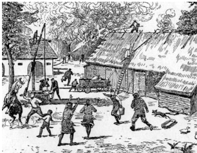
Pożar wiejskich zabudowań

Pożary od wieków niszczyły nasz kraj, obracając w perzynę nie tylko dobytek ludzi, ale i dorobek kulturalny. Największe straty występowały w dużych miastach, będących skupiskami ludności, zajmującej się handlem i rzemiosłem. W czasie pożarów pastwą płomieni padały nie tylko warsztaty pracy, majątek ruchomy, domy mieszczkańskie, ale i zabytkowe obiekty: zamki, kościoły, klasztory. Często zdarzało się, że pożar doprowadzał do ruiny materialnej społeczności miast, które już nie mogły powrócić do dawnej świetności. W okresie średniowiecza główną przyczyną tych klęsk wynikała z faktu, że prawie całe budownictwo mieszkalne, sakralne, a nawet obronne wznoszono z drewna. Tak było do XIV wieku. Dopiero w okresie panowania króla Kazimierza Wielkiego i jego następców można mówić o pewnej zmianie jakościowej budownictwa na korzyść „Polski murowanej”, ale też zazwyczaj dotyczyło to niektórych obiektów: zamków, kościołów, murów obronnych. Pewna poprawa nastąpiła w XVIII–XIX w., kiedy to – w miejsce budynków drewnianych – zaczęto coraz powszechniej wznosić obiekty z kamienia czy cegły.