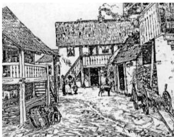
Dawna zabudowa miast i miasteczek

Wczesne osiedla miejskie budowano z drewna, co gorsza zazwyczaj bez żadnego planu. Nagminnym zjawiskiem było dostawianie drewnianych krużganków, ganków, schodów i schowków, co występowało nawet w późniejszych wiekach. Na przykład w Warszawie ratusz, usytuowany na środku Rynku Staromiejskiego, był jeszcze do początku XIX w. dosłownie obudowany kramami i warsztatami rzemieślników. W Krakowie powszechnie stosowano drewniane dobudówki i takie pokrycia dachowe. Jeszcze w XVI w. było tam dużo drewnianych domów krytych słomą. Niektóre budynki nie miały szyb, a otwory okienne zabezpieczano tylko okiennicami. Plagę pożarów najlepiej ilustruje sytuacja w dwóch najważniejszych miastach Polski: Krakowie i Warszawie. W Krakowie wielkie pożary miały miejsce w latach: 1125, 1205, 1241, 1259, 1285, 1306, 1405, 1407, 1445, 1504, 1528, 1536, 1587, a w Warszawie w latach: 1384, 1480, 1515, 1607, 1697. Groźne pożary zniszczyły też wiele mniejszych miast polskich.